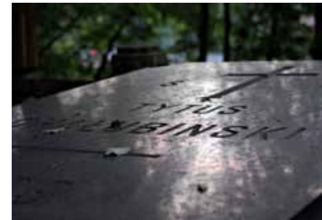
Képek szemben: Tue dionsed ercin et aut adit do exer sisim atis nim Fent: Tue dionsed ercin et aut adit do exer sisim atis nim init luptate Képek lent: Tue dionsed ercin et aut adit do exer sisim atis nim